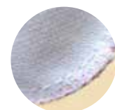
回し縫い後の「千鳥縫い」