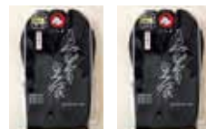
冬用 (内生地がネル生地)

朱子特有の美しく光沢のある黒は、女性にも人気があります。サイズも豊富に取り揃えております。