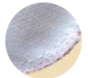
回し縫い後の「千鳥縫い」