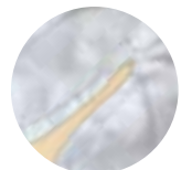
指先の縫い合わせ「爪縫い」